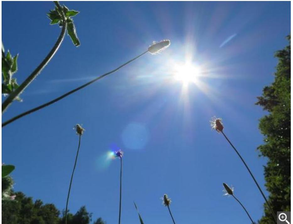
Très humide en juin avec un déficit d'ensoleillement record sur 30 ans. Chaud et sec à partir de mi-juillet jusqu'à mi-septembre.